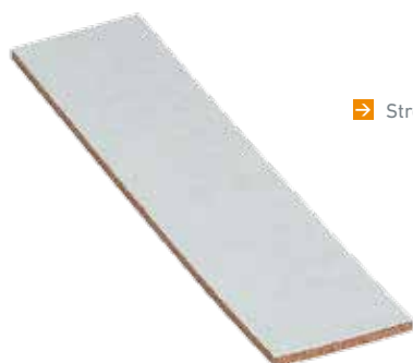
➤ Streifen Pronouvo Typ PND / PNM