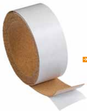
➤ Rollen Pronouvo Typ PND / PNM

Pronouvo Typ PND (härtere Qualität) / Typ PNM (weichere Qualität)